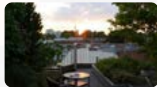
Upstalsboom Hotel Friedrichshain Gubener Str. 42 10243 Berlin