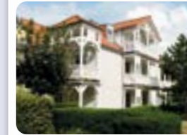
Strandstraße 32 18255 Kühlungsborn

upstalsboom-ferienwohnungen.de/strandstrasse32