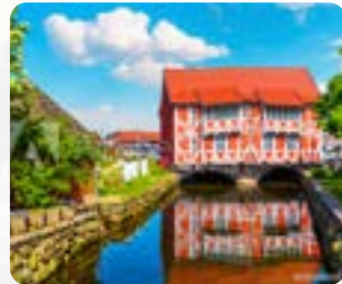
Upstalsboom Aparthotel Kruse-Speicher Alter Hafen 23966 Hansestadt Wismar