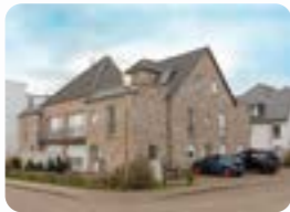
Gorch-Fock-Straße 1 26757 Borkum

upstalsboom-ferienwohnungen.de/gorchfock