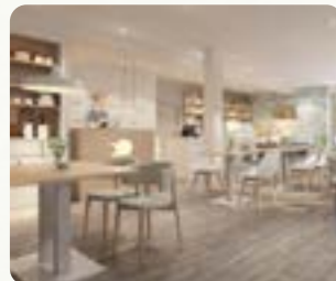
Upstalsboom Aparthotel Ostseeallee Ostseeallee 48 23946 Boltenhagen