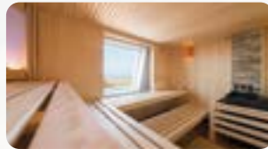
Upstalsboom Hotel am Strand Mellumweg 6 26434 Horumersiel-Schillig