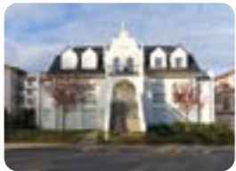
Hermannstraße 18 18225 Kühlungsborn

upstalsboom-ferienwohnungen.de/villakatharina