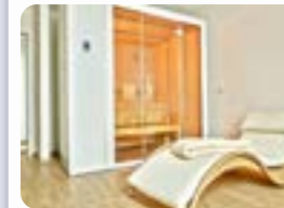
Kirchstraße 44 26757 Borkum